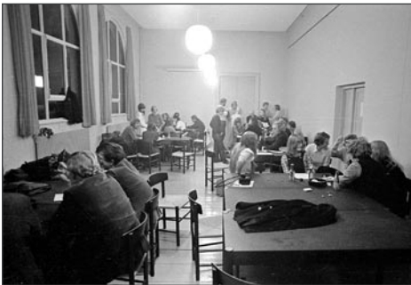
HUSETs Café 1972