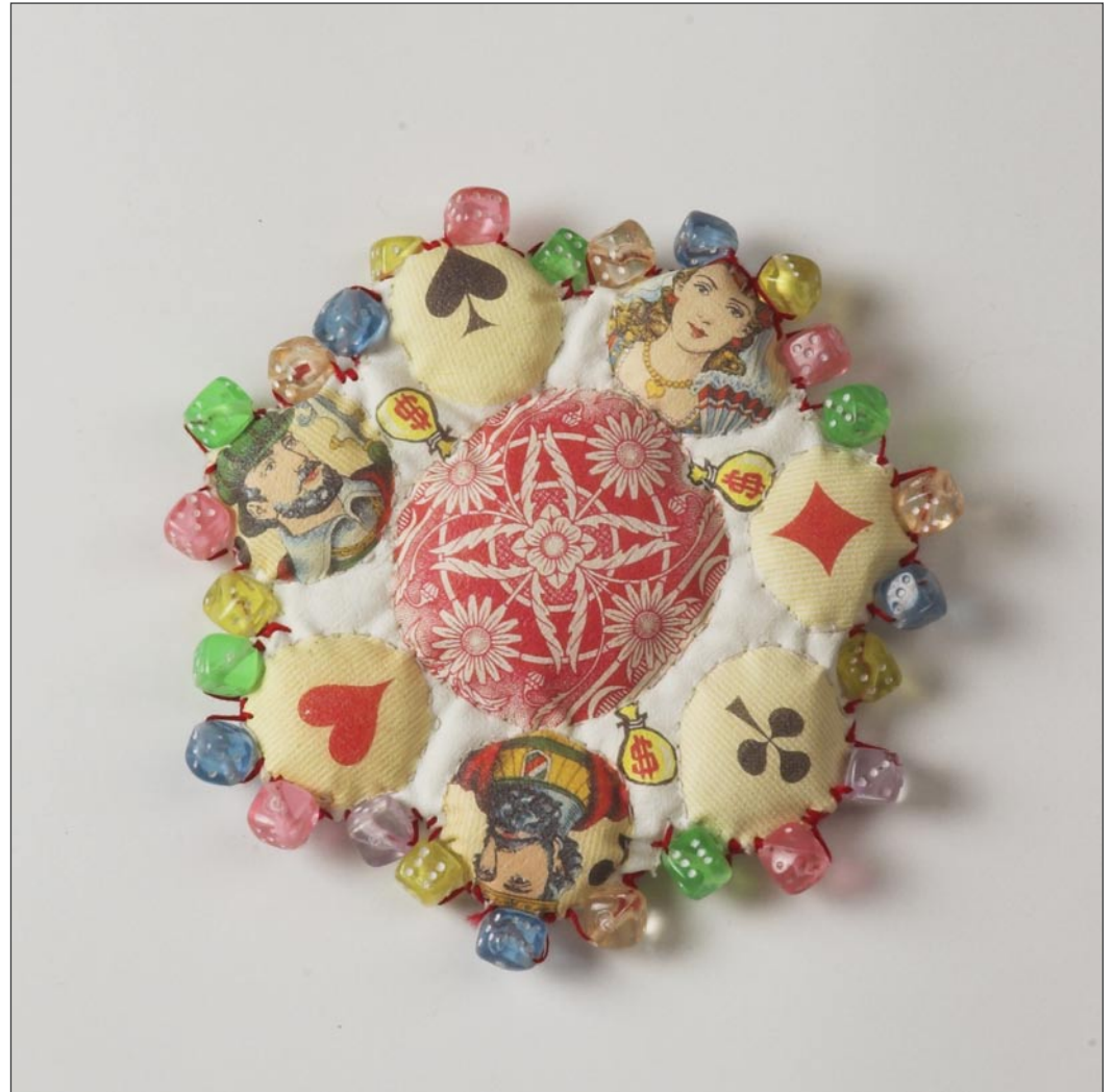
'One for every time she is away' – detalje af et værk, som består af 176 dele, 1995

For mig er HUSET det sidste sted, der adskiller Århus fra resten af de andre mellemstore provinsbyer i Danmark og fra hovedstaden.