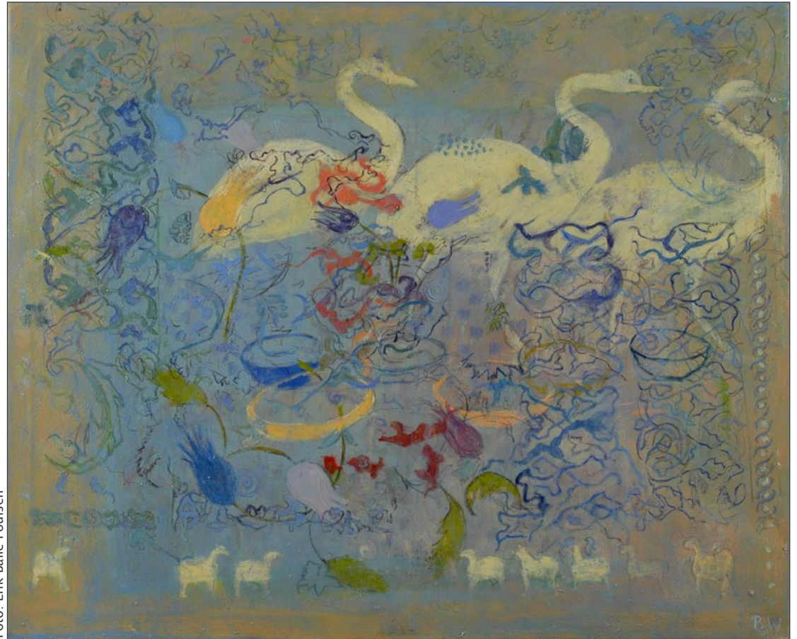
'Sarons yndigheder' af Bettina Winkelmann