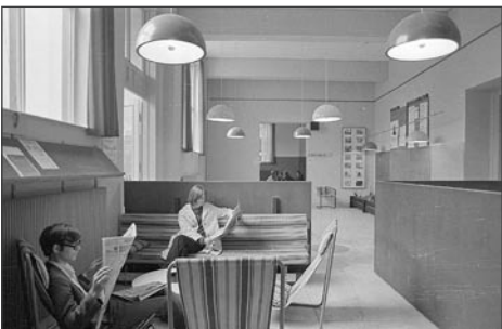
HUSETs Information 1972